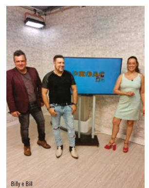
Billy e Bill